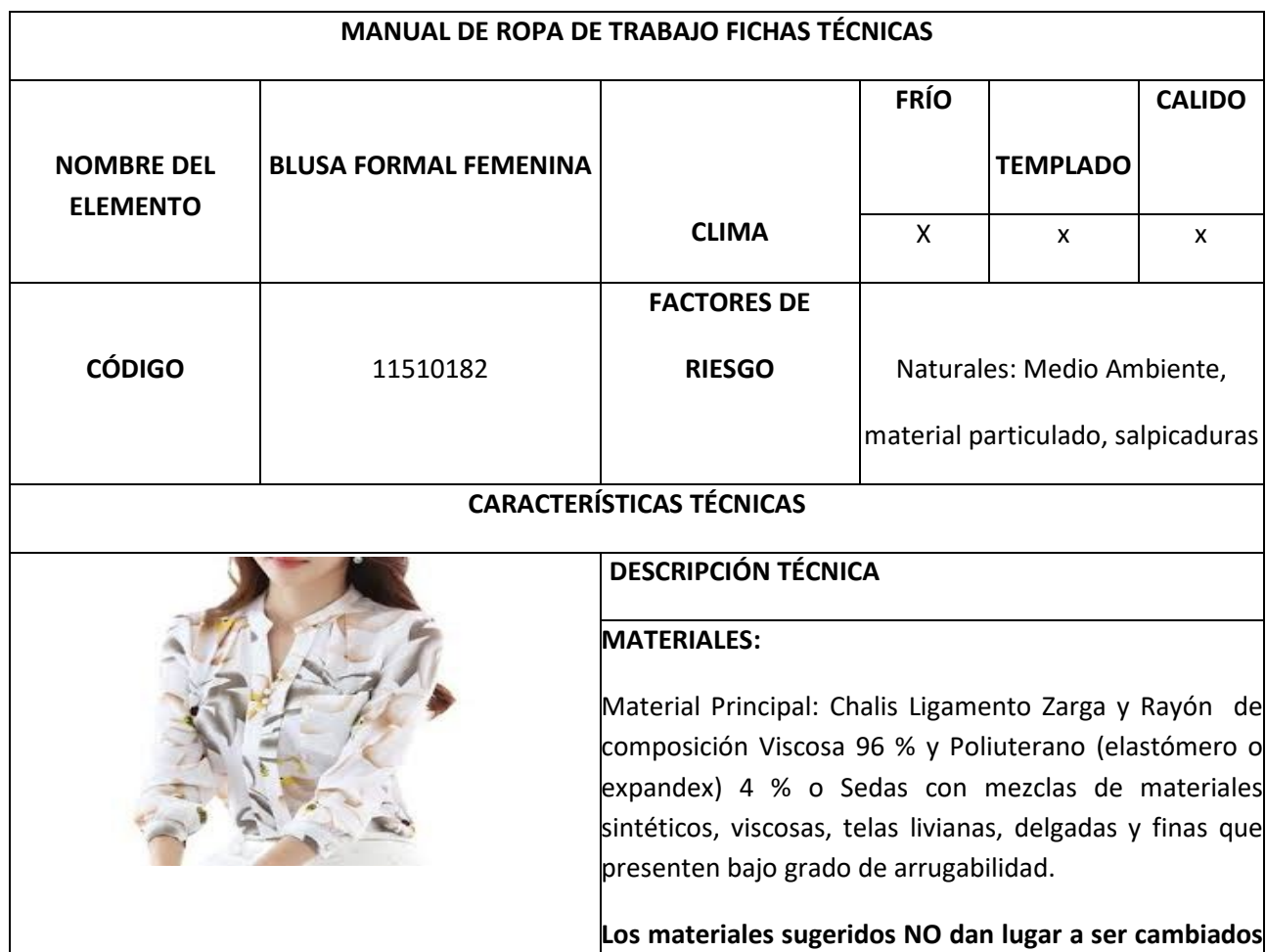
Tabla 4 FICHA TÉCNICA BLUSA FORMAL FEMENINA